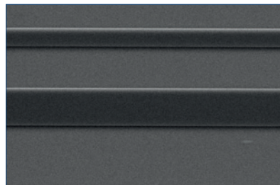
Medusa 82 UV Struktur mit erhöhter Empfindlichkeit